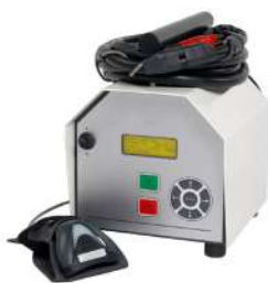
Сварочные аппараты для электрофузионной сварки