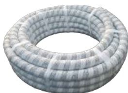
Гофрированные дренажные трубы с перфорацией и UV-фильтром