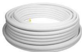
Металлопластиковые термостойкие трубы PERT-AL-PERT и фитинги к ним

- с протяжкой и без протяжки - наружный диаметр до 40 мм [внутренний - 33 мм]