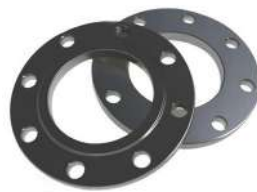
Фланцы стальные расточенные, нерасточенные, с покрытием из полипропилена и др.