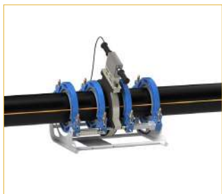
Монтажные работы по сварке труб