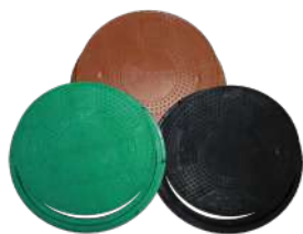
Люки и крышки для люков металлопластиковые