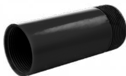
Модули из ПНД безнапорные