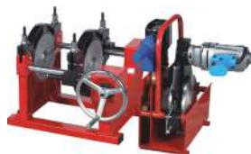
Сварочные аппараты для стыковой сварки С гидравлическим и механическим приводом, для труб диаметром от 40 до 1000 мм