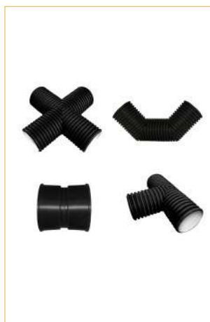
Фитинги для гофрированных труб