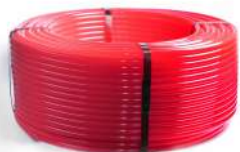
Трубы и фитинги для теплых полов, систем снеготаяния, горячего водоснабжения

- однослойные PE RT - однослойные с антидиффузионным слоем [PERT-EVOH]