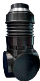
Колодцы из полиэтилена с фасонными частями