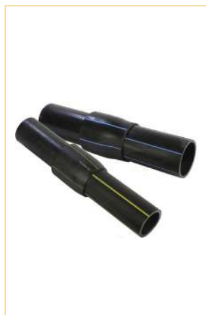
Неразъемные соединения «полиэтилен-сталь»