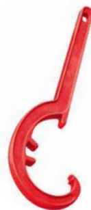
Вспомогательное оборудование (лебедки, ключи, штанги телескопические)