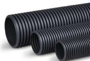
Гофрированные трубы однослойные

- с протяжкой и без протяжки - наружный диаметр до 40 мм [внутренний - 33 мм]