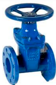
Арматура запорная Затворы, задвижки, вентили и др.